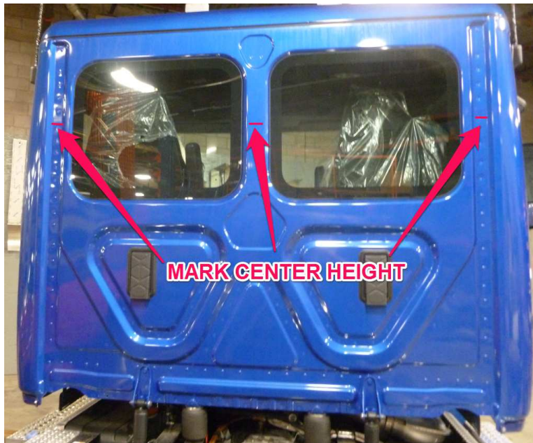
Image 1 - Marquage des lignes mi-hauteur