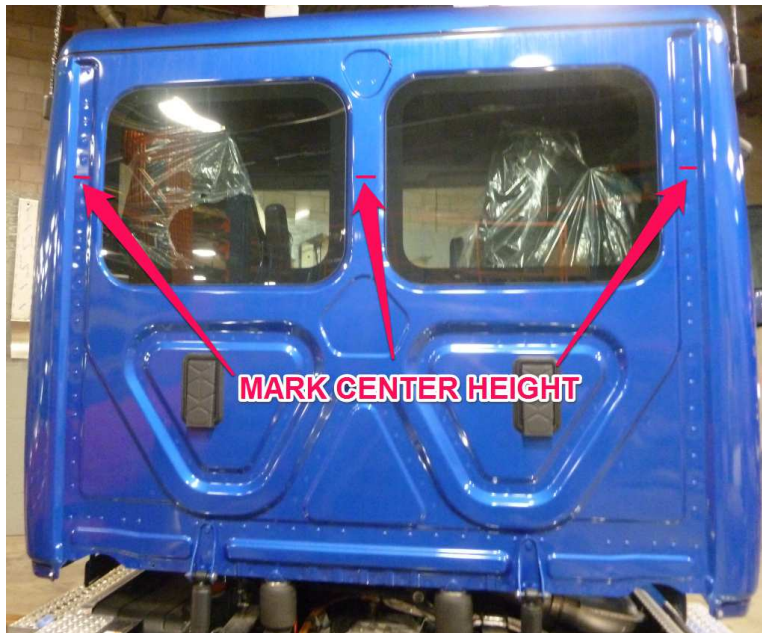
Figure 1 - Marking Center Lines